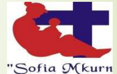
რეპროდუქციული ჯანმრთელობის ცენტრი „სოფია მკურნალი“