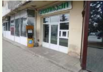
აფთიაქი „გორი ფარმი“