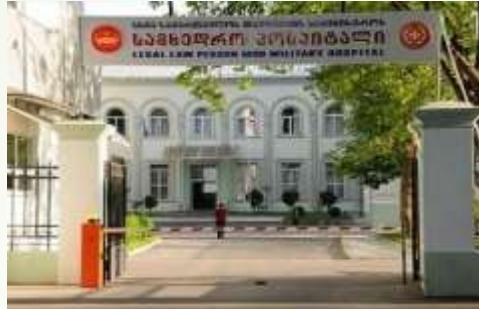
ს.ს.ი.პ. გიორგი აბრამიშვილის სახელობის თავდაცვის სამინისტროს სამხედრო ჰოსპიტალი