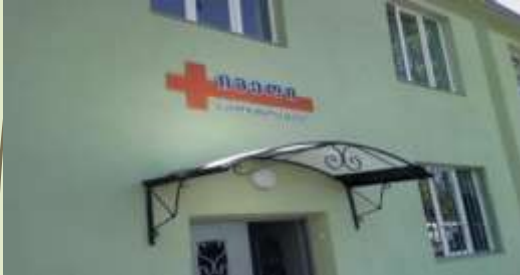
კლინიკა "იმედი და მარიამი"