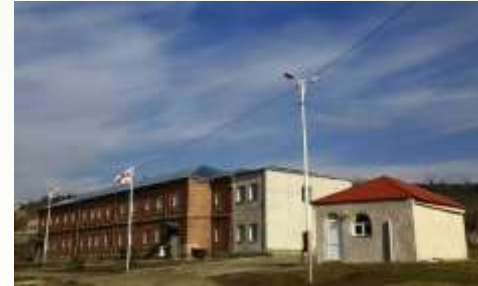
აღმოსავლეთ საქართველოს ფსიქიკური ჯანმრთელობის ცენტრი