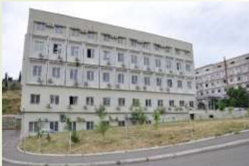
თბილისის ფსიქიკური ჯანმრთელობის ცენტრი